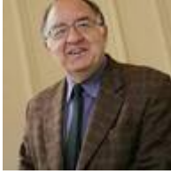
Ricardo García Cárcel

“España merece un bicentenario de 1808, con memoria abierta y plural, sin reducciones sectarias, que sea capaz de evocar la guerra (con sus victorias y sus miserias) y al mismo tiempo, explorar los caminos que conducen del Levantamiento de 1808 a la Revolución de 1812. La Revolución que fue y la que no pudo ser. La España real y la imaginaria. Sin prejuicios ni complejos.”