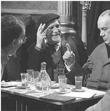
Escena de “La Colmena”

“No pienses con palabras, es mejor que procures ver la imagen” Jack Kerouac